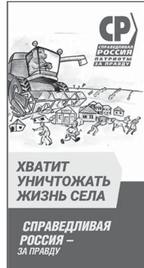
ХВАТИТ УНИЧТОЖАТЬ ЖИЗНЬ СЕЛА СПРАВЕДЛИВАЯ РОССИЯ - ЗА ПРАВДУ

Публикуется на безвозмездной основе по результатам жеребьевки от 17.08.21.