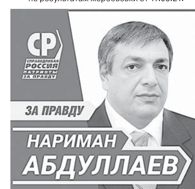
Публикуется на безвозмездной основе по результатам жеребьевки от 17.08.21.