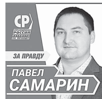
Публикуется на безвозмездной основе по результатам жеребьевки от 17.08.21.