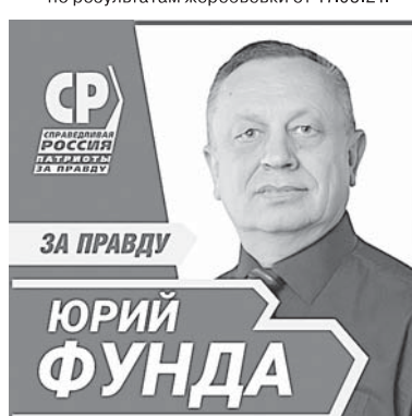
Публикуется на безвозмездной основе по результатам жеребьевки от 17.08.21.