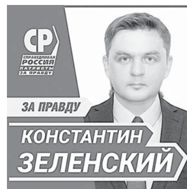
Публикуется на безвозмездной основе по результатам жеребьевки от 17.08.21.