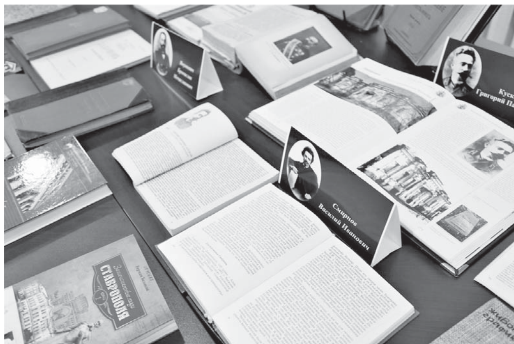
Фрагмент выставки «Собрание имен достойных».