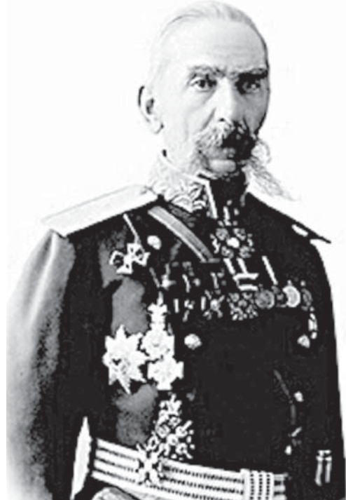
Василий Александрович Потто.

Традиционные краеведческие губернские чтения в Ставропольской краевой библиотеке им. М.Ю. Лермонтова задумывались как «живой календарь» юбилейных и памятных дат личностей, известных в дореволюционном Ставрополе. И этот календарь вновь дает хорошую пищу для размышлений о судьбах Отечества.