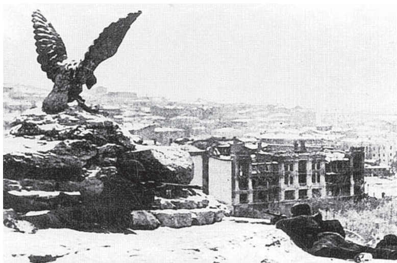
Советские автоматчики ведут бой за Пятигорск. Январь 1943 года.

роли региона. Память о событиях Битвы за Кавказ важно сохранить и передать новым поколениям. Много народов живет на Кавказе и в России, а история у нас одна, и Победа одна, общая, завоеванная нашими отцами и дедками.