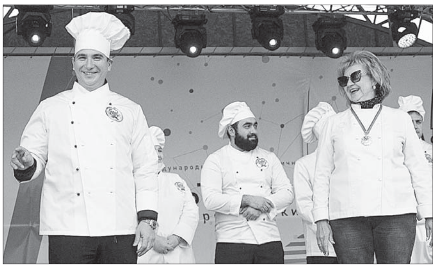
(Окончание. Начало на 1-й стр.).

С ЕКРЕТ приготовления того самого соуса для пропитки блинчиков выведать не удалось. А вот о том, что для вкусного курника каждый слой начинки нужно обжаривать отдельно, профи журналистам все же рассказала.