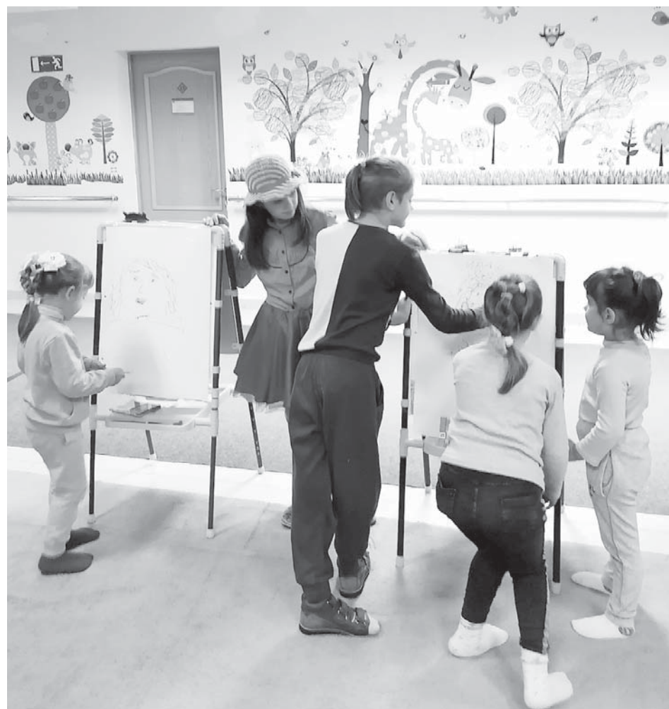
Занятия в реабилитационном центре «Орленок».