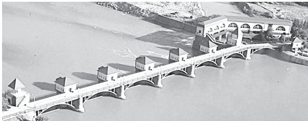
Большой Ставропольский канал - одна из главных артерий краевой мелиорации.