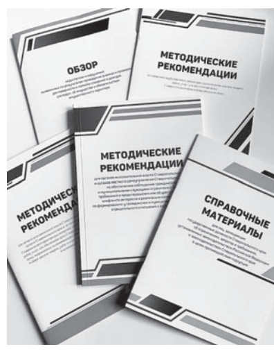
Методические рекомендации, которые ежегодно разрабатываются управлением губернатора СК по профилактике коррупционных правонарушений.