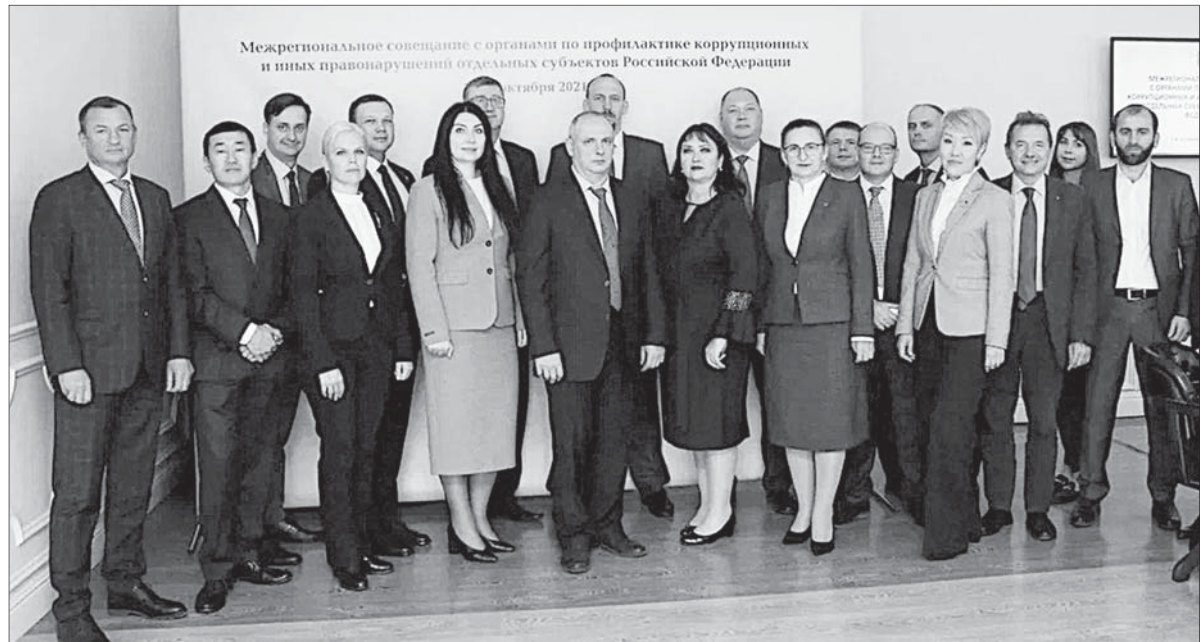
Участники межрегионального совещания в Туле, прошедшего под эгидой Управления Администрации Президента РФ по вопросам противодействия коррупции.

Ставропольским краем на межрегиональном совещании были представлены на экспертное обсуждение методические материалы по профилактике кор-