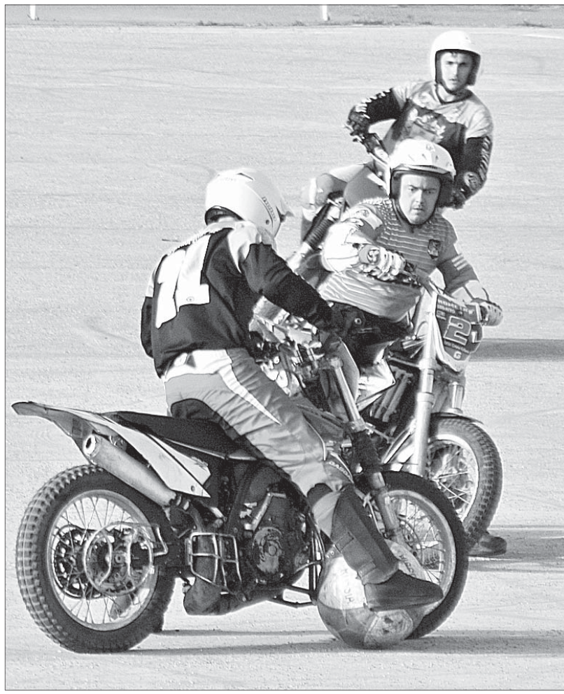
В ДУМЕ КРАЯ