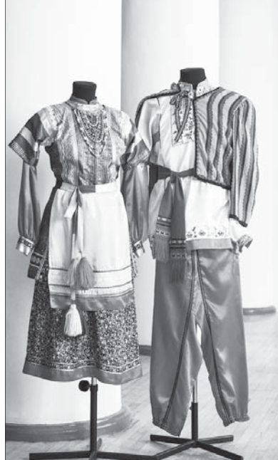
Костюм некрасовских казаков.