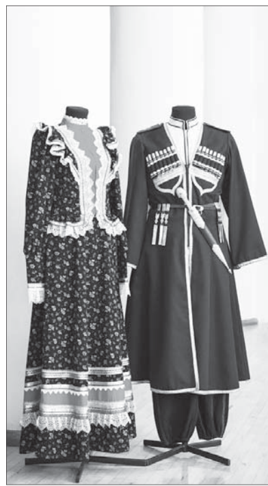
Казачий костюм артистов хора.

Профессионалы, занимающиеся фольклором, единогласно скажут: создание народного костюма -