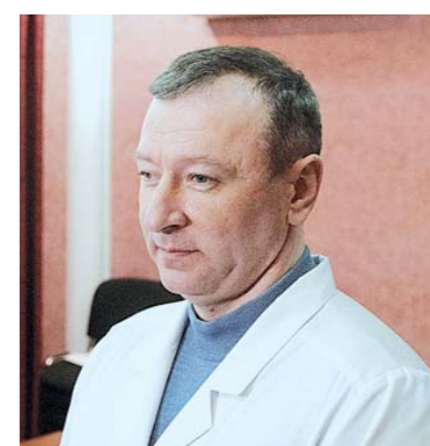
димирирова, больших сложностей удалось избежать: глава региона заключил контракт на поставку медицинского газа из Азербайджана.