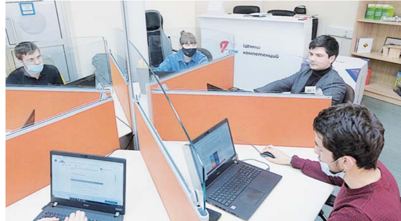
Президентской платформы «Россия - страна возможностей» для Stavropol'skaya Pravda и студентов всего округа.