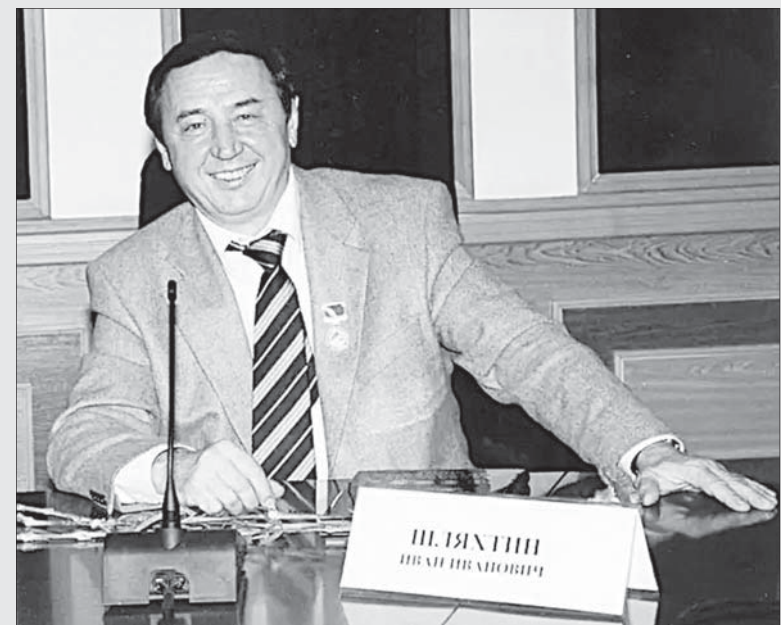
Член Международной академии телевидения и радио, член правления Евразийской академии телевидения и радио, а также федеративного совета Союза журналистов России. Лауреат десятков профессиональных и общественных наград и званий, заслуженный работник культуры Российской Федерации. Награжден орденом Почета и орденом Дружбы.

РОДИЛСЯ он 1942 году в селе Никаноровка Ростовской области. В 1969 году закончил отделение журналистики Ростовского государственного университета. С июля 1969 года началась его журналистская карьера в качестве литработника, заведующего отделом в газете «Приазовская степь» Неклиновского района Ростовской области. С декабря 1974 года он - старший корреспондент, заведомом промышленности, строительства, транспорта и связи краевой газеты «Ставропольская правда». С сентября 1986-го по март 1988-го - завсектором печати, телевидения и радиовещания Ставропольского крайкома КПСС, а позже - председатель комитета по телевидению и радиовещанию Ставропольского крайисполкома. С 1992-го по 2006-й - президент Ставропольской государственной телерадиовещательной компании. В 2006 - 2007 гг. - советник регионального департамента Всероссийской государственной телевизионной и радиовещательной компании (ВГТРК).