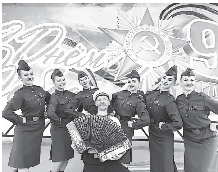
Материалы рубрики подготовила НАТАЛЬЯ БЫКОВА.

В концертную программу «Горячий снег» вошел яркий казачий фольклор и, конечно же, песни военных лет, которые по-прежнему популярны в народе. Они выдержали испытание временем, стали своеобразным музыкальным памятником далеким героическим лет. В них и сейчас звучат удивительный оптимизм, не-