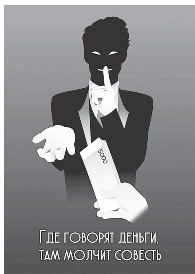
Автор плаката - Александра Пьянкова, Новосибирск.

Среди наших разработок изготовление печатной продукции антикоррупционного характера, в том числе буклетов, календарей, плакатов (за 2020 - 2021 годы изготовлено более 17500 экземпляров полиграфической продукции), направленной на пропаганду и формирование нетерпимого отношения у граждан к коррупции (папок, брошюр, ручек и другого), методических рекомендаций и материалов антикоррупционной направ-