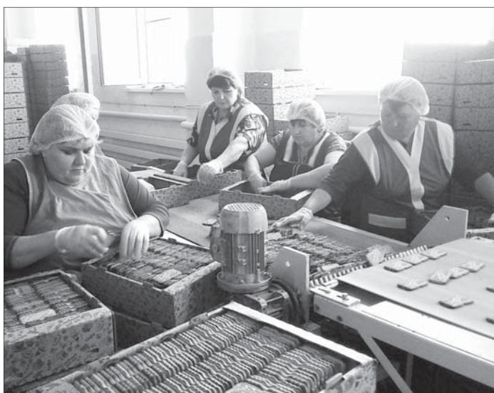
В кондитерском цеху идет процесс выпечки и упаковки печенья.

Нынешней весной в колхозе заложили демонстрационные посевы с десяткой гибридами кукурузы отечественной селекции, подсолнечника, свеклы, производимых в Краснодарском и Ставропольском краях. С ними, кстати, в «Родине» работают не первый год, результат хороший. Средствам защиты и удобрениям тоже отдали предпочтение нашим, российским, потому проблем с их приобретением не возникает. Как показало время, так много надежнее и спокойнее, самое глав-