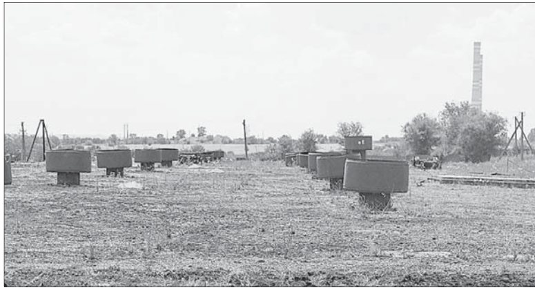
Под этими наземными сооружениями - чистойшая питьевая вода.

РАБОТЫ, начавшиеся в 2020 году, реализованы в три этапа. Вначале заменили аварийный участок в 2,8 км у хутора Спорного. Затем модернизировали еще один участок протяженностью 3,7 км - от съезда с трассы Ставрополь - Изобильный по направлению к станции Староизобильной до поселка Рыздвяный. И наконец, в рамках третьего этапа положили еще один километр трубы взамен старой износившейся. Финансирование по первым двум этапам обеспечил бюджет Ставропольского края. В 2020 - 2021 годах на это было направлено 48,7 млн рублей. Третий этап Крайводоканал осуществил по поручению главы края за собственные средства.