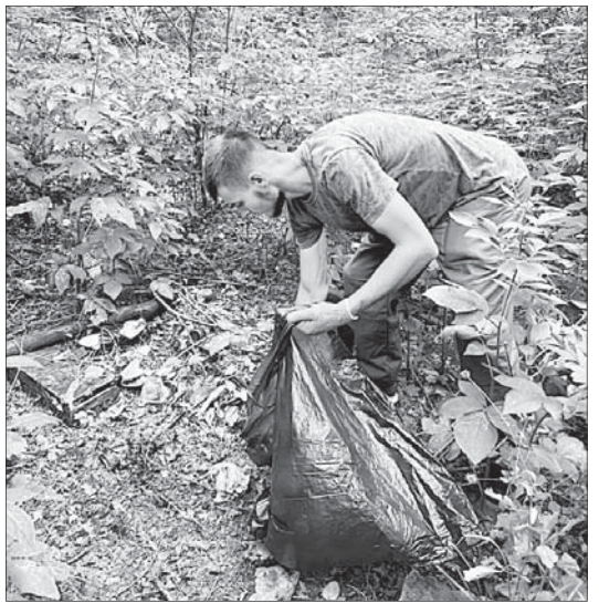
Уже на следующий день делегация из числа

Очередной субботник состоялся на территории археологического и природно-ландшафтного музея-заповедника Татарское городище. Такие акции давно стали традиционными. На этот раз в уборке заповедной территории приняли участие сотрудники отдела «Татарское городище» Ставропольского государственного музея-заповедника, работни-