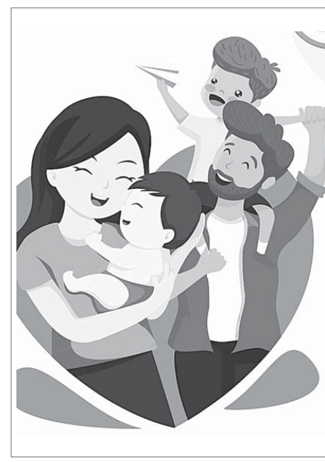
Материалы рубрики подготовила НАТАЛЬЯ БЫКОВА.

Кроме того, за счет регионального проекта в первом полугодии жителям Ставропольского края, страдающим бесплодием, выполнено 996 процедур экстракорпорального оплодотворения, а организационными социальными услугами Ставропольского края предоставлены услуги по социальному сопровождению семей, находящихся в трудной жизненной ситуации, в первом полугодии 2022 года оказано 15560 тысяч услуг.