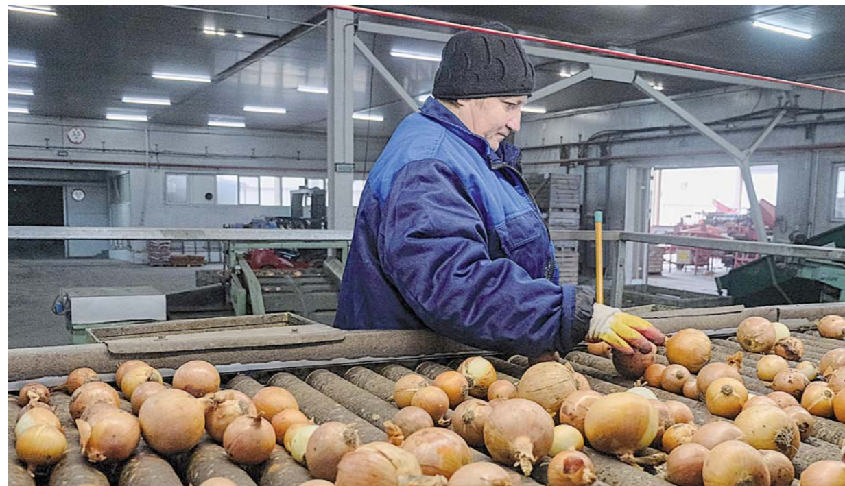
На овощехранилище в Красногвардейском округе работа кипит - идет сортировка и упаковка овощей для реализации и закладки на хранение.

Овощехранилище в селе Преградном этого сельхозпредприятия Красногвардейского округа - одно из крупнейших в крае. Оно вмещает 35000 тонн овощной продукции и оснащено линиями по подготовке, сортировке, мойке и упаковке. Картофель, лук, морковь фасуются в пакеты и сетку от одного до 25 килограммов. Мощность упаковочных линий - до 20 тонн в час. Большим подспорьем для ово-