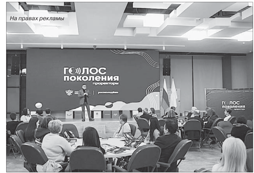
Мероприятие с тренером.