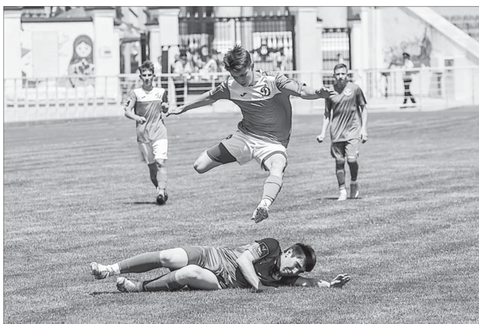
Юные динамовцы наглядно доказали, что ставропольская земля не оскудела футбольными талантами.

Кроме того, в рамках государственной программы Ставропольского края «Развитие физической культуры и спорта» продолжается строительство Дворца спорта «Арена Кисловодск». Масштабное строительство планируется осуществлять в три этапа. Общий объем финансирования объекта в 2020 – 2021 годах составил более 850 миллионов рублей (более 510,2 миллиона рублей из федерального бюджета и свыше 342,6 миллиона рублей – из краевого). В 2022 году на эти цели выделено более миллиарда рублей (около 530,9 миллиона рублей из федерально-