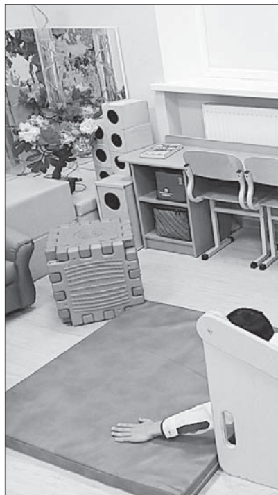
Занятия с тренажером объятий.