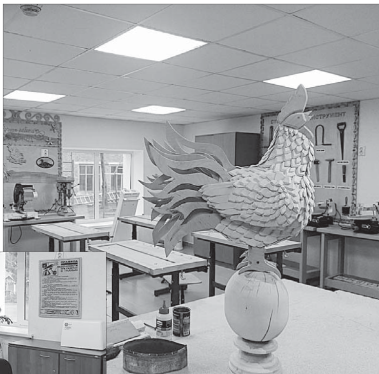
В столярной мастерской готовят очередную конкурсную работу.

ние - тренажер «Крепкие объятия». Он полезен для детей с нарушениями аутистического спектра, привлекает к ощущению безопасности тактильных ощущений. Приобрели и