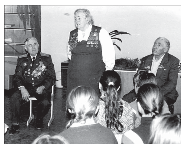
Дети центра внешкольной работы слушают воспоминания фронтовиков о друзьях-товарищах.

Сотни отважных бойцов полегли на территориях Левокумского и нынешнего Нефтекумского районов. Особенно ожесточенные бои шли под аулом Камы-Бурун (ныне микрорайон Нефтекумск), у сел Ачикулак, Новкус-Артезиан. Несмотря на большие потери кавалеристов, враг не прошел туда, где проводи-