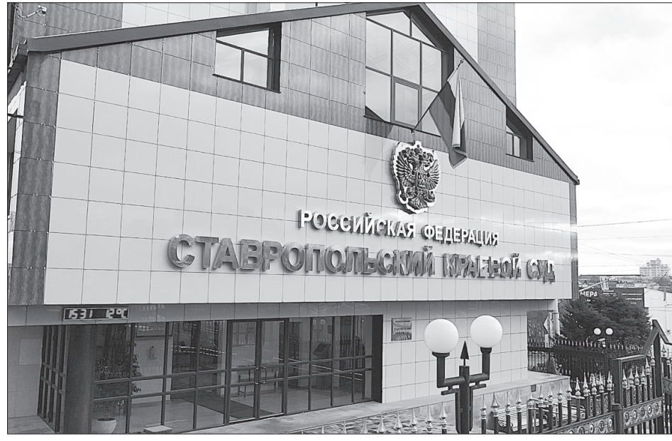
Главный корпус Ставропольского краевого суда.