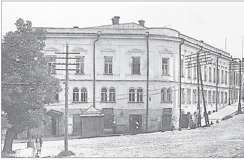
Здание Ставропольского окружного суда.