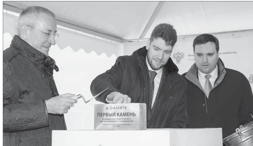
Закладка символического первого камня в строительство селекционно-генетического центра овцеводства компании «Дамате».

кстати, по производству баранины увеличена вдвое - почти до 36 миллионов рублей.