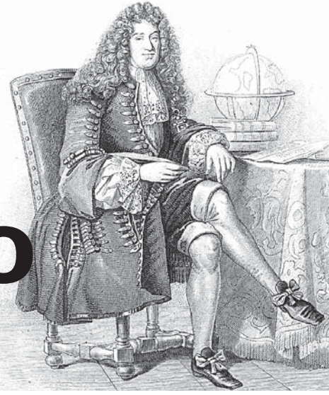
Жан-Франсуа Реньяр.