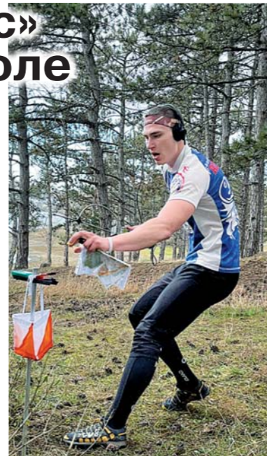
М. ВИКТОРОВ.

Теперь ставропольские «охотники на лис» готовятся к национальному первенству и всероссийским соревнованиям, которые пройдут в конце апреля в Горячем Ключе.