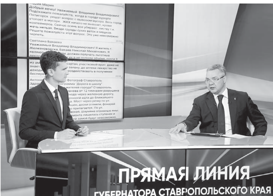
Еще 65 дорожных объектов общей протяженностью более 170 километров приведут в этот год в порядок благодаря национальному проекту «Безопасные и качественные дороги».

В 2023 году региональный дорожный фонд достиг рекордного значения и превышает 18 миллиардов рублей. Из них 9,1 миллиарда рублей направлено на строительство и ремонт муниципальных дорог. Запланировано привести в нормативное состояние более 400 километров дорог местного значения и около 300 километров дорог регионального значения.