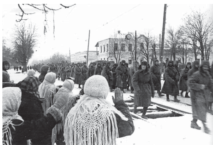
Жители Ставрополья встречают воинов-освободителей. Январь 1943 года.

туристско-краеведческой, театрально-концертной, музейно-реконструкторской, военно-спортивной, поисковой работы.