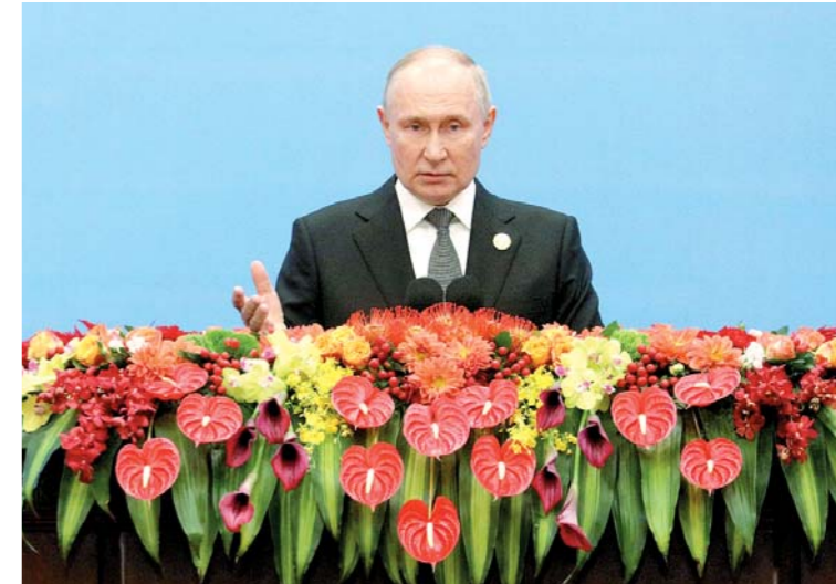
Глава Российского государства выступил на Третьем Международном форуме «Один пояс, один путь».

«ЭТО действительно глобальный план, - подчеркнул Владимир Путин, - Согласно с Председателем КНР в том, что китайская идея «Один пояс, один путь» логично вписывается в многосторонние усилия по укреплению созидательного и конструктивного взаимодействия в масштабах всего мирового сообщества».