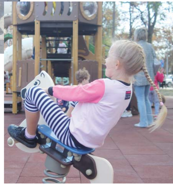
АЛЕКСАНДР МАЩЕНКО. Фото автора.

Мониторинг хода реализации регионального проекта осуществляется указанным краевым министерством на заседаниях межведом-