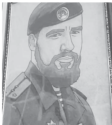
Н. ПАНТЕЛЕЕВА.

Экспозиция открылась накануне Дня героев Отечества. Организаторы напоминают: посещение выставочного комплекса бесплатное.