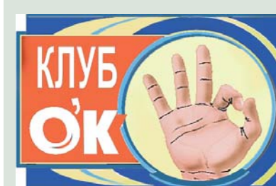
Н. ПАНТЕЛЕЕВА.

Стратегическое мышление - это когда снимаешь белую футболку перед тем, как есть борщ.