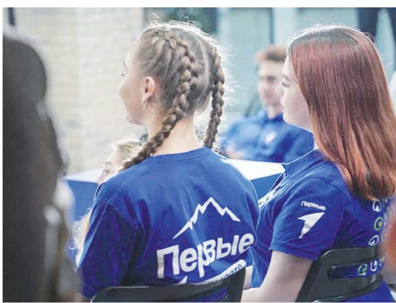
По материалам пресс-службы губернатора СК.

Отметим, что Общероссийское общественно-государственное движение детей и молодежи «Движение Первых» создано в 2022 году по инициативе Президента России Владимира Путина. К настоящему времени число его участников превышает 4 млн человек. Движение активно развивается и на Ставрополье. В регионе действуют более 600 первичных отделений «Движения Первых», в его рядах около 37 тысяч юных ставропольцев. При поддержке правительства края успешно реализуются проекты в сфере патриотического воспитания и популяризации детского и молодежного пешеходного туризма.