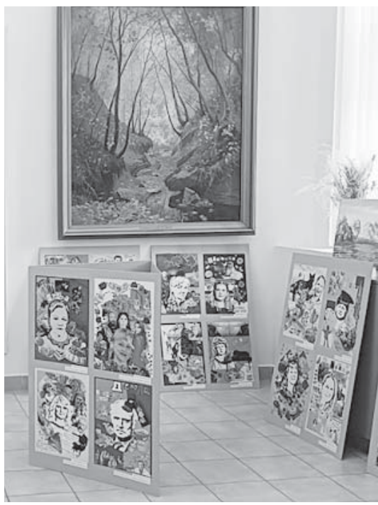
Фото Картинной галереи пейзажей художника П.М. Грешишкина.