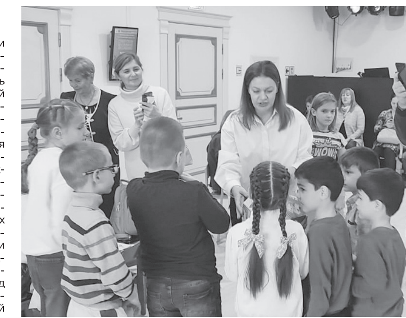
Финансовая сказка в театре кукол.