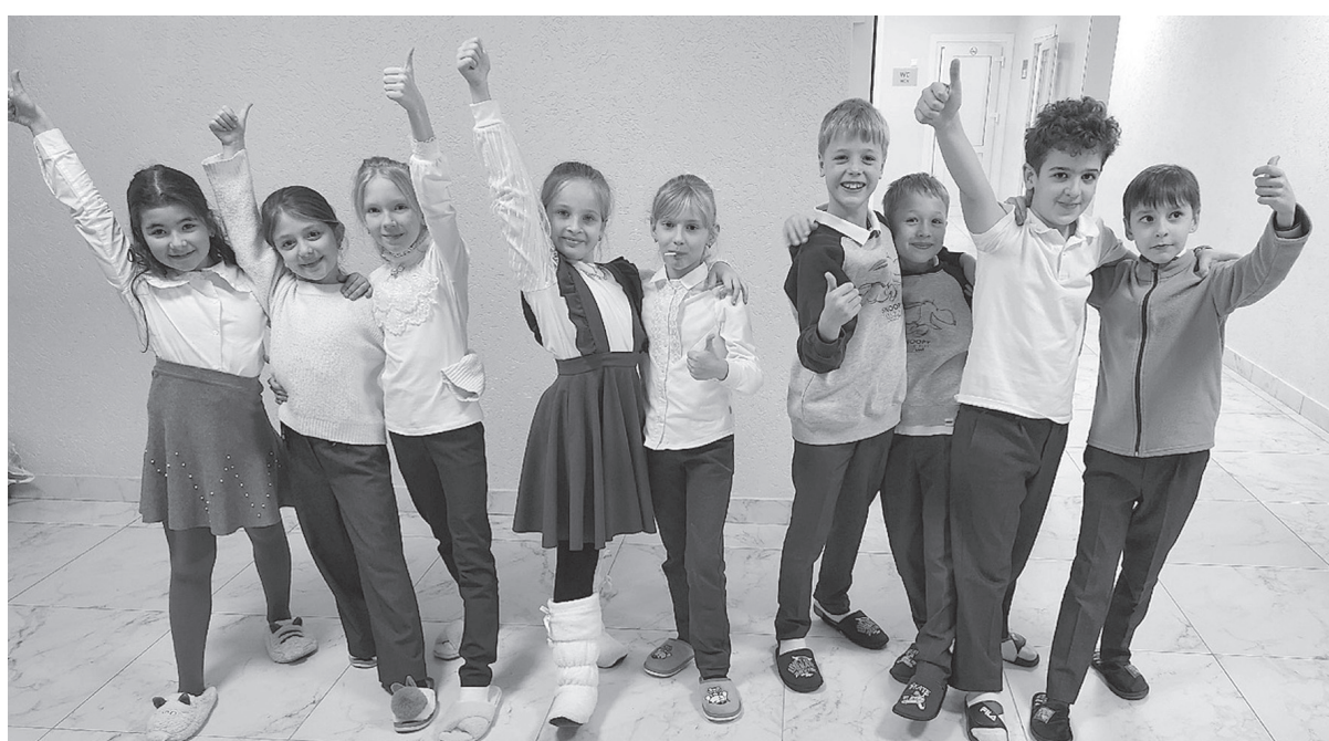
Е. АЛЕКСЕЕВА.

ра». А в последний учебный день года я вместе с замками перевоплощаюсь в волшебных героев. И мы пойдем дальше в своих начинаниях, - поделилась Ирина Шатская. Конечно, в полномочиях ведомств думать о благополучии наших детей, но теплом окутывают их именно те, кто напрямую работают с ними. Неравнодушные педагоги не только учат дисциплинам, но и жизнелюбию во всех его гранях. Там, где есть любовь к ребятне и профессии, - счастливое детство.