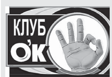
Н. БЫКОВА.

Хотите увидеть восстание машин - спросите у колонки: «Алиса, кто на свете всех умнее, всех прекрасней и белее - ты, Сири или Маруся?»