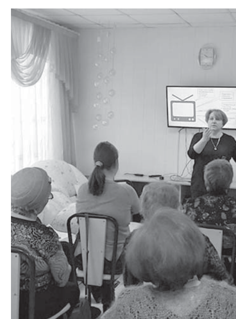
Занятия в выездной школе финансовой грамотности для взрослых.

годы: ставропольцы знают об организации, защищающей права потребителей финансовых услуг, понимают важность накоплений и грамотнее распоряжаются имеющимися деньгами. Теперь предстоит следующий этап, когда будет решаться более сложная задача по развитию финансовой культуры, то есть определенных ценностей и поведенческих установок, характеризующих более рациональное финансовое поведение.