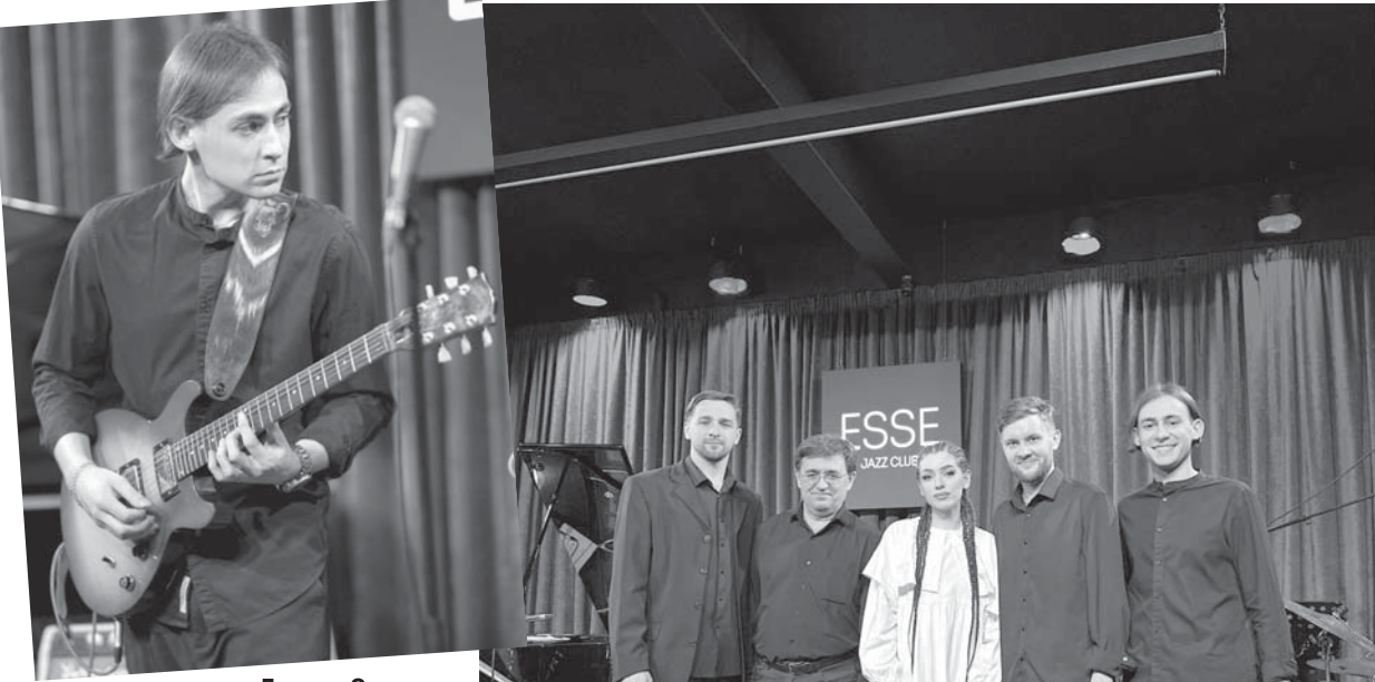
Квинтет Voyagers Jazz Project в полном составе.

Ставропольский квинтет Voyagers Jazz Project успешно выступил с большой концертной программой на престижной сцене Ростова-на-Дону - в джаз-клубе Esse.