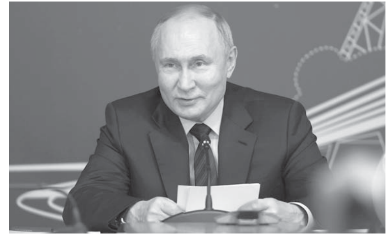
Владимир Путин побывал в Верхней Пышме (Свердловская область), где посетил ООО «Уральские локомотивы».

На площадке предприятия глава государства провел совещание о строительстве высокоскоростной железнодорожной магистрали между Москвой и Санкт-Петербургом и перспективах работы на данном направлении развития транспортной инфраструктуры.