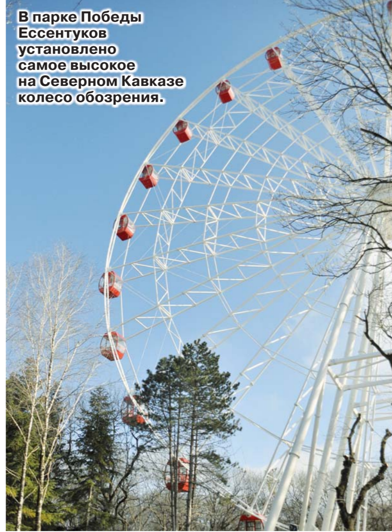
В парке Победы Ессентуков установлено самое высокое на Северном Кавказе колесо обозрения.

Е ГО высота - 65 метров. В середине марта аттракцион пройдет техническую приемку на соответствие безопасности и после запуска, который планируется осуществить к майским праздникам, будет работать круглый год: все 24 кабинки закрыты и оснащены сплит-системами.