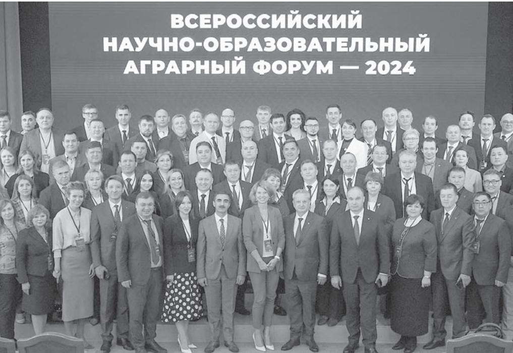
ВСЕРОССИЙСКИЙ НАУЧНО-ОБРАЗОВАТЕЛЬНЫЙ АГРАРНЫЙ ФОРУМ — 2024

имеет особое значение для Ставрополья - одного из агропромышленных лидеров в стране. Каждый пятый сотрудник в отрасли - старше 60 лет, а доля молодых специалистов, в возрасте до 25 лет, - всего шесть процентов. Как прозвучало на форуме, без внедрения новых подходов по привлечению абитуриентов обеспечить кадровую ротацию будет все сложнее. Одно из решений проблемы - закрепление бизнеса за школами и его привлечение к учебному процессу. - Ставропольский государственный аграрный университет уже движется в заданном Министерством сельского хозяйства России фарватере, - констатировал ректор СтГАУ