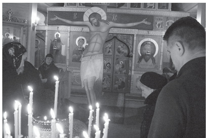
Первые три дня седмицы посвящаются усиленному приготовлению к страстям Христовым, богослужения в храмах становятся особенно продолжительными. Затем Великий четверг посвящается воспоминаниям о Тайной вечере Спасителя с учениками, Гефсиманском молении, взятии под стражу Христа и суду первосвященников и прокуратора Иудеи Понтия Пилата. В Страстную пятницу, самый строгий постный день года, не совершается Божественная литургия, верующие поклоняются спасительным страданиям Господа. Наступает Великая суббота: люди в ожидании чуда схождения Благодатного огня на Гроб Господень в Иерусалиме. Это не просто день подготовки к Пасхе, это день, исполненный великой духовной радости, хотя еще продолжается строгий пост, который завершится с наступлением Пасхи - Воскресения Христова.

вершаются особые службы. Богослужения Страстной седмицы особенно величественны вдохновенными песнопениями.