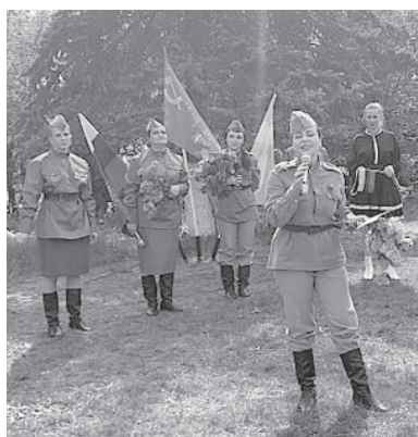
Материалы подготовила Н. БЫКОВА.

менную патриотическую «Небо славы». Песни дополняют друг друга и напоминают нам о непреходящих ценностях - любви к Родине, стойкости духа, преданности и справедливости», - рассказывают артисты фронтовой концертной бригады «За Победу!» из Предгорного района. До Дня Великой Победы фронтовые творческие бригады успеют дать десятки концертов по всей территории края. Присоединиться к поздравлениям защитников и поддержать выступления фронтовых бригад может любой ставропольец, выбрав в графиках выступлений ближайший населенный пункт и посетив концерт. Ежегодная краевая творческая акция «Фронтовые концертные бригады» проводится с 2016 года. Организаторами выступают министерство культуры Ставропольского