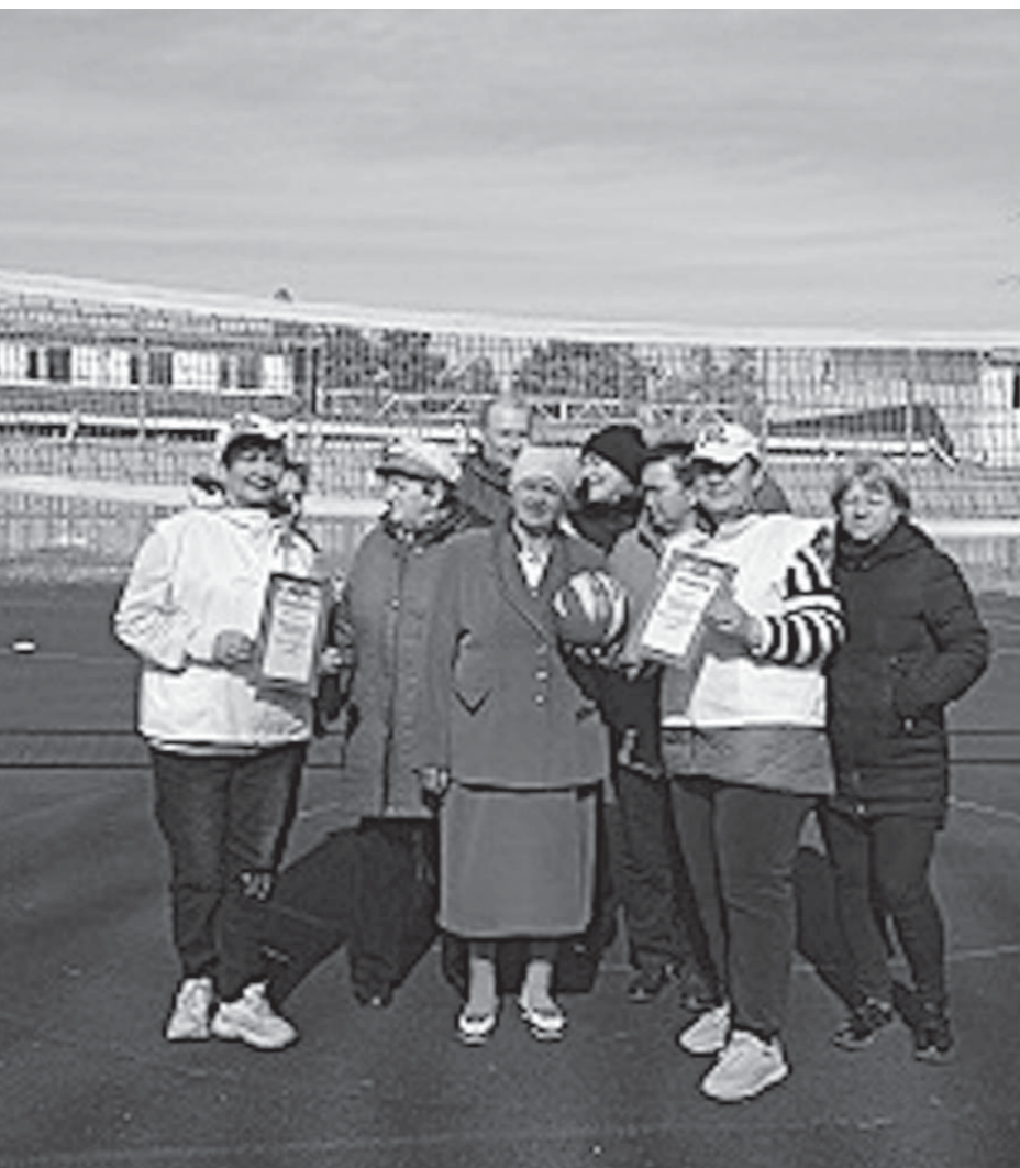
В отделении социального обслуживания на дому Кочубеевского центра социального обслуживания населения станции Барсуковской популярен клуб «Час здоровья».

В целом можно сказать, что предоставление социальных услуг гражданам пожилого возраста и инвалидам, нуждающимся в уходе, в Ставропольском крае