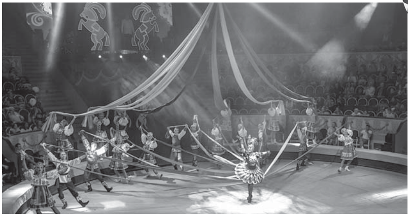
Сейчас государственную цирковую компанию.

Инициатором новой экспозиции в Ставропольском государственном музее-заповеднике стал Ставропольский государственный цирк - филиал Российской государственной цирковой компании. 29 мая здесь будет представлена фотовыставка «Цирк в фокусе», посвященная 105-летию Росгосцирка.