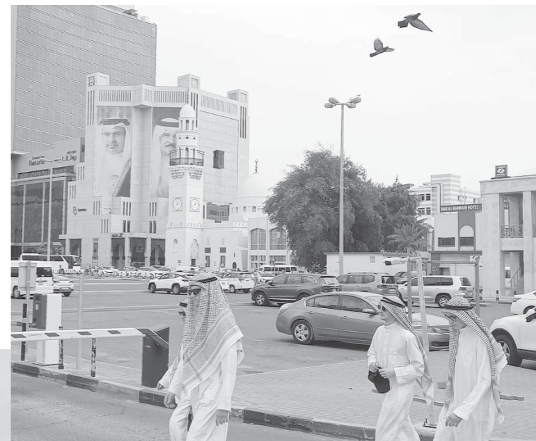
Около 10% населения Бахрейна составляют христиане.