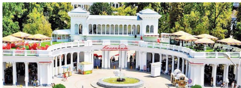
Колоннада украшает главный вход в Курортный парк Кисловодска.

По данным Главного управления МЧС России по Ставропольскому краю, с начала года пожаров в лесных массивах Ставрополья не было. Но при этом зафиксировано 995 ландшафтных пожаров, когда горели сухостой, камыши, стерня на полях. Больше всего таких слу-