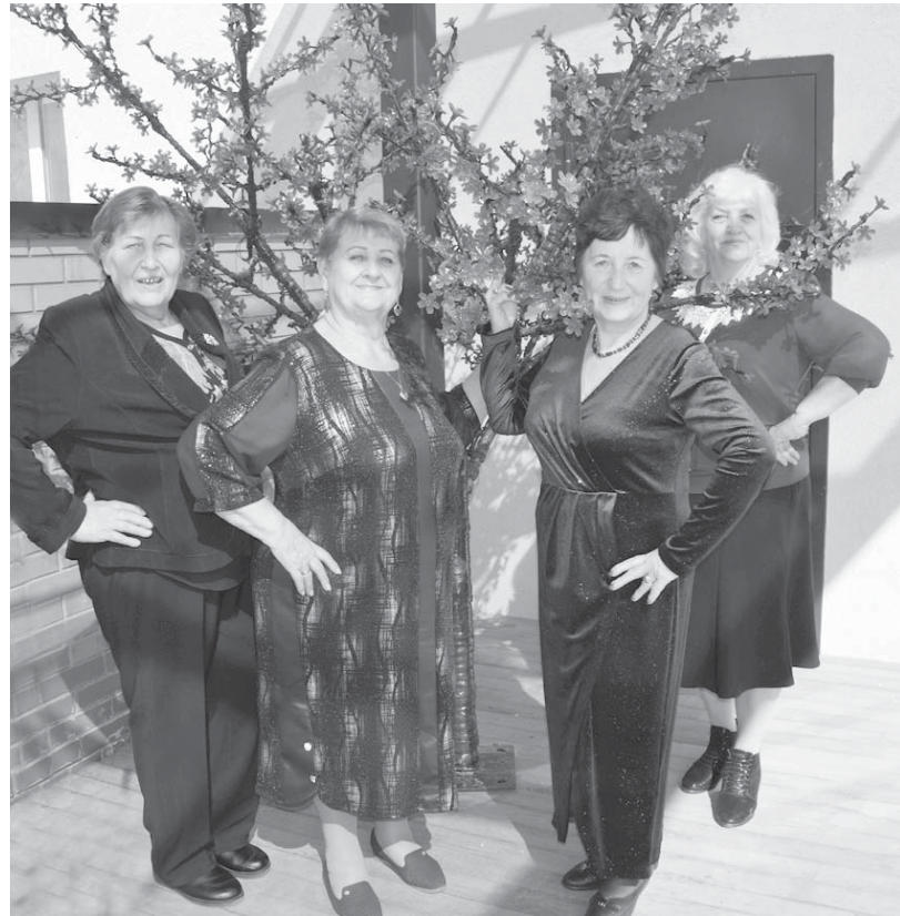
Фото на память в день, когда в клубе «Родник жизни» чествовали юбиляров.

В клубе ветеранов «Родник жизни», который успешно действует в Апанасенковском округе вот уже 17 лет, состоялась очередная встреча. На этот раз она была посвящена сразу четырем активисткам клуба.