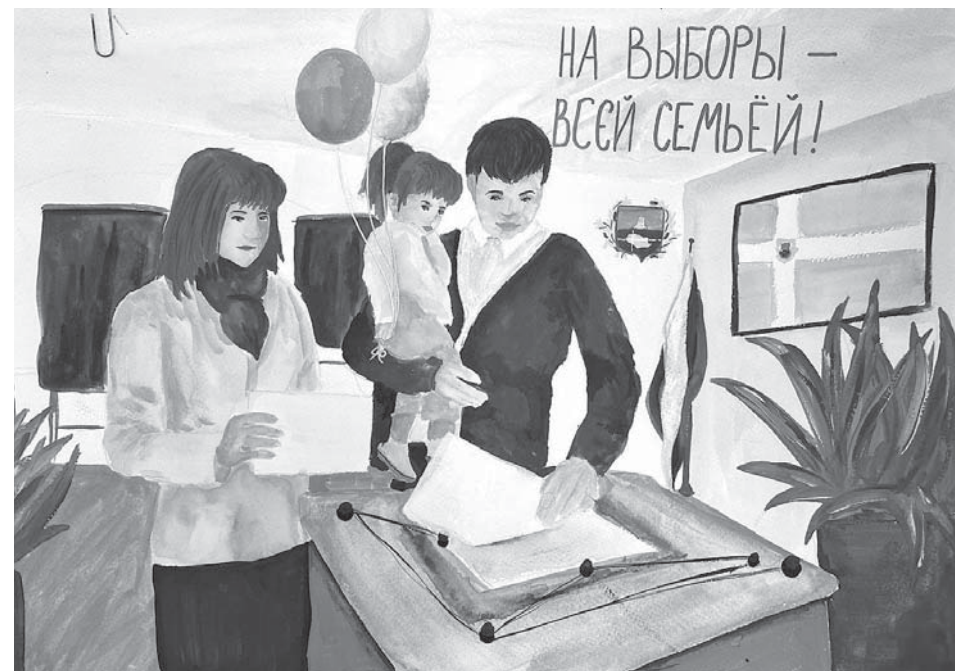
Автор рисунка Анастасия Бандурина (Ставрополь).

торые организует для повышения интереса к избирательному процессу.