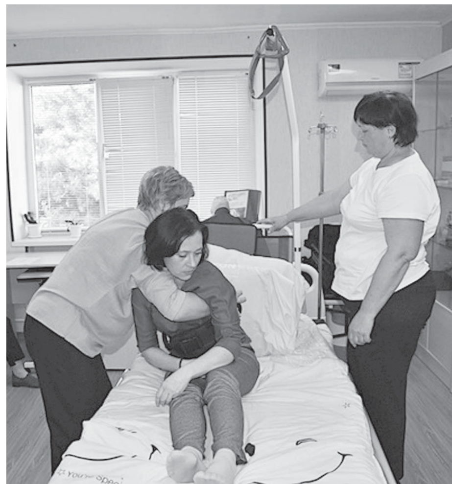
Занятия в «Школе ухода»: здесь все желающие могут приобрести навыки практического ухода за людьми пожилого возраста и инвалидами.

специальную профессиональную подготовку. В течение года в школах ухода обучается более 1 тысячи человек.