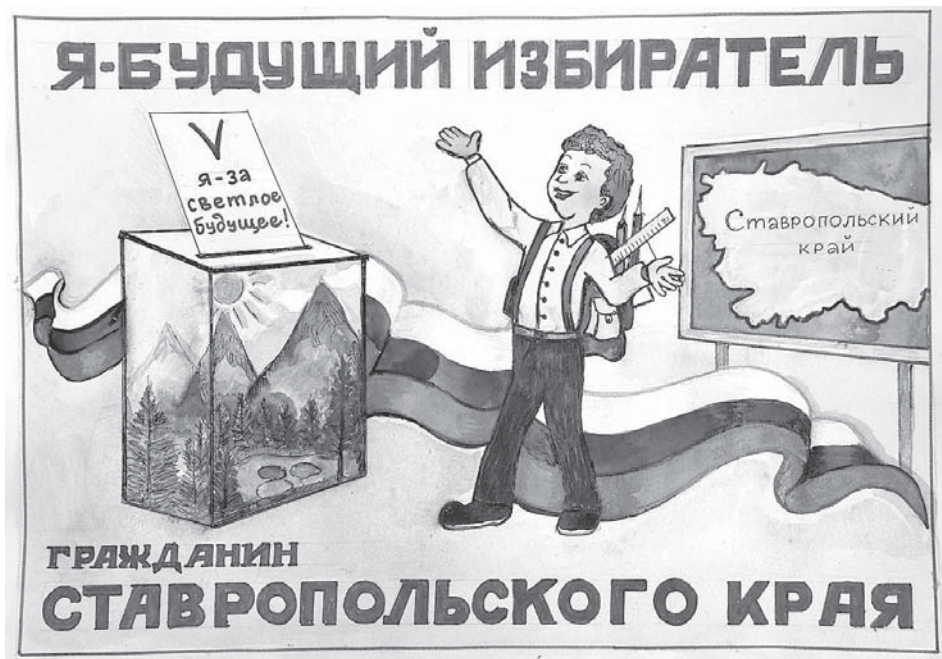
Автор рисунка Василий Климов (Предгорный муниципальный округ).

Победителей конкурсов наградят дипломами и ценными призами. Сертификаты получат все ребята, представившие свои работы на творческие конкурсы. Рисунки и сочинения избирательная комиссия Ставропольского края будет использовать на различных мероприятиях, ко-