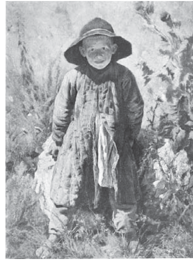
Н.А. Ярошенко. «Постреленок», 1891 г. Государственный музей изобразительных искусств, Туркменистан.

столицы Туркменистана Ашхабаде, оказывается, хранится другая его работа – «Постреленок», причем это – еще один портрет мальчика Сени! Девушка решила по возвращении на Родину обязательно побывать в Государственном музее изобразительных искусств в Ашхабаде и сфотографироваться с «Постреленком». Вот так в судьбе туркменской девушки Гульшат нашло отражение взаимное стремление жителей бывшей единой страны - Советского Союза, не смотря на все политические перипетии современного мира, не забывать друг друга, изучать культуру наших народов. А на «Белой вилле» теперь с не-