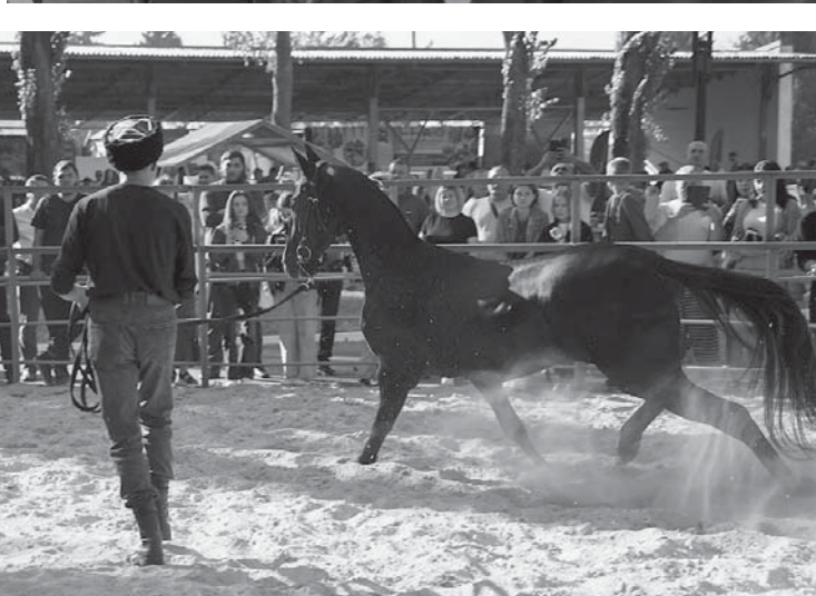
По материалам пресс-службы губернатора СК.