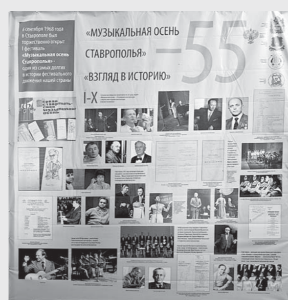
джазовых и рок-исполнителей, принимавших участие в фестивале в разные годы.

Первая «Музыкальная осень» прошла в Ставрополе с 6 по 15 сентября 1968 года. Изначально фестиваль ставил своей целью знакомство жителей региона с творчеством ведущих композиторов, поэтов-песенников и артистов не только Ставропольского края, но и всей страны. Благодаря «Музыкальной осени» ставропольцы смогли первыми услышать новые произведения многих знаменитых композиторов, ныне классиков, а ведущими концертов тогда были дикторы Центрального телевидения. На выставке представлены фотографии с концертов, поэтических вечеров и творческих встреч, документы, афиши и программы фестиваля «Музыкальная осень Ставрополя», которые иллюстрируют более чем полувековую историю этого крупного культурного события нашего края. Здесь можно увидеть фото отечественных и зарубежных композиторов, музыкантов, поэтов, оперных и эстрадных певцов, выступления хоровых, танцевальных и балетных коллективов, симфонических оркестров,