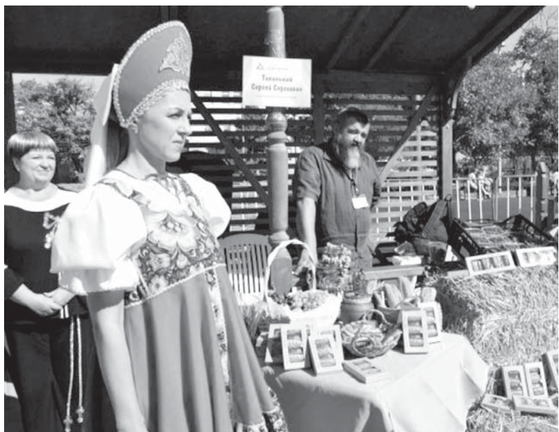
На первом краевом фестивале соцконтрактников «Мое дело», прошедшем в Георгиевске.

на территории России. Организация должна быть включена в специальный реестр. Их список размещен на сайте министерства образования Ставропольского края. Обратиться за компенсацией может родитель ребенка участника СВО, его законный представитель либо доверенное лицо родителя. Подать заявление о назначении и выплате компенсации необходимо в орган социальной защиты населения по месту жительства. Решение о назначении компенсации принимает миносоцзащиты края в течение десяти рабочих дней со дня получения заявления и необходимых документов. Выплата производится в течение пяти рабочих дней. В 2024 году такая выплата произведена по заявлению 125 получателей на 157 детей на общую сумму 3,125 миллиона рублей.