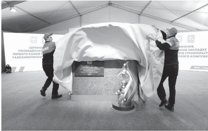
Церемония открытия памятного знака - первого камня на строительстве нового газохимического комплекса в Буденновске. Здесь будет выпускаться востребованное минеральное удобрение - карбамид. Проект планируется реализовать в течение пяти лет.

Среди приоритетов ведомства - поддержка реального сектора экономики, где создаются рабочие места и организован выпуск продукции с высокой добавленной стоимостью, участников СВО и членов их семей, семейного бизнеса, ин-