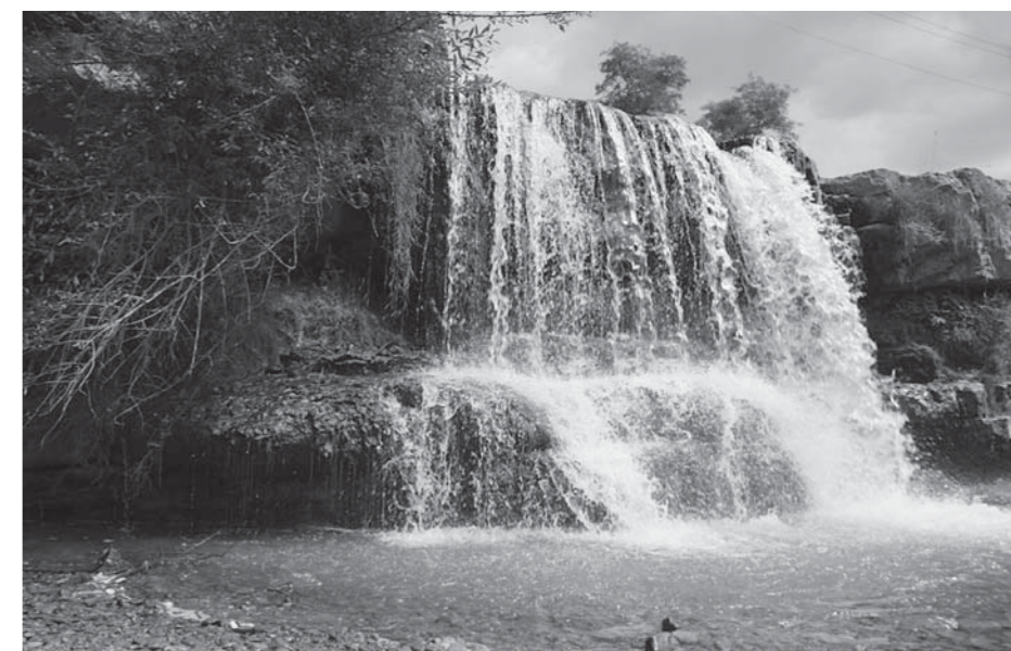
Памятник природы «Лермонтовский водопад».

ПЕРВАЯ экологическая тропа была открыта в 2017 году в заказнике «Стрижамент», по ней уже прошли десятки тысяч туристов. Она пользуется большой популярностью у жителей края и туристов из других регионов страны. Созданы и многие другие увлекательные маршруты. Один из недавно открытых - в природном заказнике «Александровский». Он тянется через лесопестуную экосистему заказника и оснащен навигационными указателями, предупреждающими табличками. Маршрут включает три тропы: учебно-экологическую, историческую и геологическую общей протяженностью 25 километров. Самый длинный маршрут - одиннадцать километров.