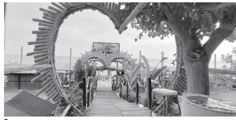
Вход на пляж.