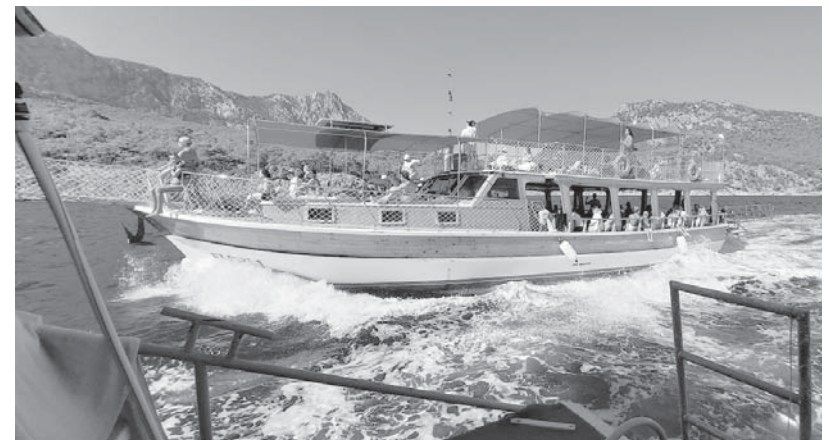
Гонки с конкурентами.

подергиванием наживки прямо перед их носами результатов не давали. Правда, не все оказались такими неудачниками. За два часа ловли наш коллектив выловил больше десятка форелей. В числе везунчиков оказалась и моя жена, чем очень возгордилась. Всю пойманную нами форель вкусно пожарили, добавив к нашей добыче еще с десяток рыбин в подарок. Обед был превосходным! К форели подали сухое вино, салаты и свежеспеченные лепешки. Позже нас поблаговали замечательным пловом с вкуснейшей бараниной, затем подали чай. Отдохнув после обеда в тени огромных деревьев и купив сувениры, отправились в обратный путь. Завершился день ночным купанием в теплом море под звездным небом. Купаться в Средиземном море одно удовольствие! Вода здесь более соленая, чем в Черном море, и поддерживает тело гораздо лучше. Когда-то это море высохло полностью, а на его месте образовался самый крупный на планете соляной бассейн, потом море опять заполнилось, а соль растворилась. Интенсивное испарение тоже повышает плотность воды. Поэтому при медленном плавании ноги всплывают к поверхности, мешая плыть! Такого эффекта в Черном море никогда не бывает. Однако привыкаешь к тако-