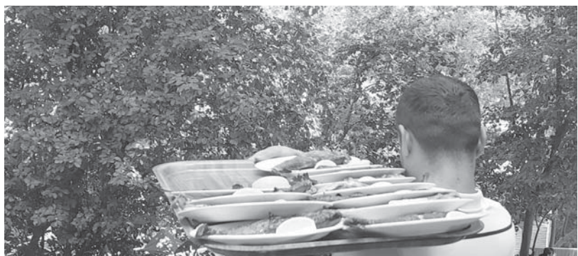
Разнос жареной форели после рыбалки.

газинах по QR-коду и снимал наличные лиры в банкоматах. Пополнять карту можно рублями и в Турции, со своих российских карт. Правда, для этих операций нужен интернет. Мне его «раздал» турок, за что я был ему очень благодарен. Роуминг снимает по Кемеру закончилась за полночь. Наш отель второй линии имел обычный набор услуг - бассейн, сауна и хамам. Жили в стандартном номере с хорошим обслуживанием и трехразовым питанием. Пляж находился в 10 минутах ходьбы от отеля и был, к сожалению, из крупной гальки разного размера. Ходить по нему и прилегающему дну было очень неудобно и с непривычки даже больно. Зато температура воды была +29 градусов и держалась та-