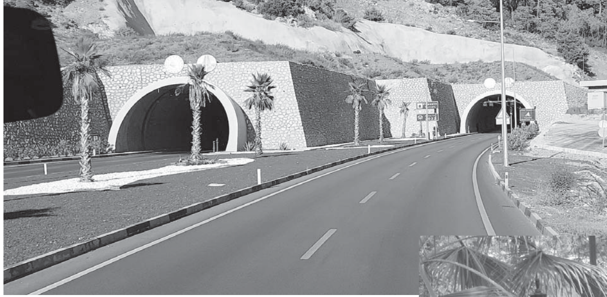
Тоннель возле Кемера.

Минеральные Воды опять стали стартовой площадкой нашего путешествия, на этот раз в Турцию. Удобно устроившись в креслах самолета, взмыли в небеса, рассчитывая через пару часов попасть в настоящие лето. Пилот подтвердил наши ожидания, сообщив, что в аэропорту Анталя +31 градус! Два часа полета быстро подошли к концу. С высоты полета над горной Турцией (средняя ее высота над уровнем моря около тысячи метров) сотни километров ее Средиземноморского побережья кажутся извилистой лентой, зажатой между Западным Таврским хребтом и морем. Однако, снизившись, понимаешь, что провинцию Анталя называют Турецкой Ривьерой не зря.