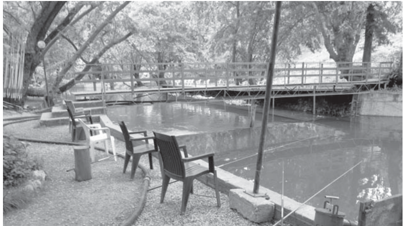
Форелевая рыбка ждет нас.