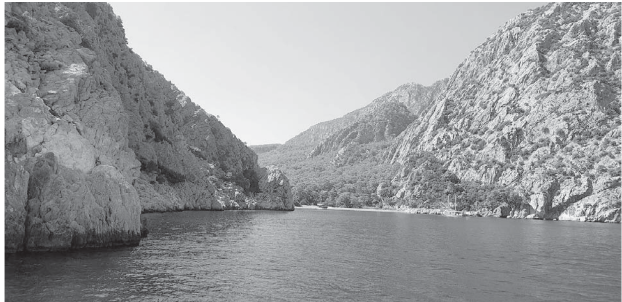
Вхождение в закрытую бухту.

Красивая горная дорога из аэропорта закружила нас в своих крутых поворотах. Сейчас даже трудно себе представить, что до 1960 года в Кемер можно было добраться только по морю. Кстати, общая длина дороги, которая заканчивается на границе с Ираном, составляет 2057 ки-