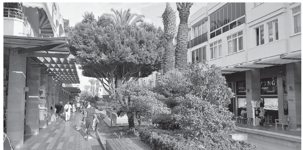
Центральная улица Кемера.

удалась, но нас подкарауливали «людоеды» - кусачие рыбки! Никогда бы не поверил, что меня на пляже в Кемере кто-то может включить в свой рацион. Но я сильно ошибался и, видимо, обладая отменными вкусовыми качествами, в первых рядах попал на зуб этим отвратительным тварям! Зайдя в воду, я сразу поплыл к боновым ограждениям, а вернувшись и остановившись в воде для разговора с женой, почувствовал резкий укол в щиколотку, затем еще один, и еще, и еще. Было больно, и, выйдя из воды, я увидел покусанную ногу, из которой текла кровь. Такие же вскрикивания звучали отовсюду. Позже узнал, что кусачие рыбки, старающиеся ухватить за самое больное место: морозь или ранку на коже, пытаются откусить кусочек побольше! Нападали они стаями на тех, кто неподвижно стоит в воде. Укусывали похороны на узоры иголкой. Большой опасности они не представляют, но общение с ними удовольствия тоже не доставляет. В море водятся более опасные хищники - сарганы, скаты и мурены, поэтому купаться рядом со скалами, гротами и пещерами нужно осторожно. После обеда по живописнейшей дорожке променада,