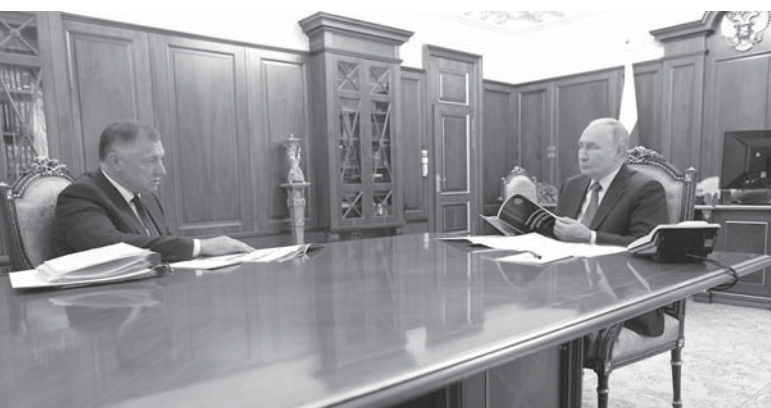
Президент провел рабочую встречу с заместителем Председателя Правительства РФ Маратом Хуснуллиным. Тема - формирование новых нацпроектов.

«3» АКОНЧИЛИ формирование проекта «Инфраструктура для жизни», - проинформировал вице-премьер. - Он в себя включил проект «Жилье и городская среда» и «Безопасные и качественные дороги». В этом году мы заканчиваем эти два национальных проекта, они за шесть лет показали свою эффективность. По жилью мы выполнили все показатели. По дорогам тоже все показатели выполнили.