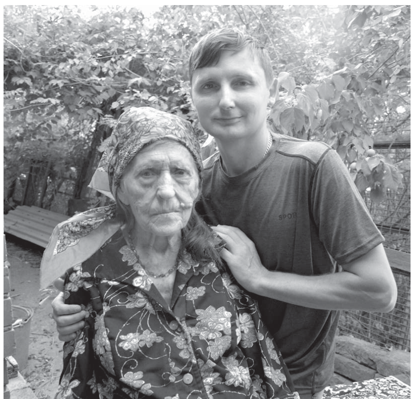
- Бабушка, родняк, возьми и меня к себе.

Пожилая женщина и молодой мужчина неспешно прогуливаются по рынку или ближайшим к нему магазинам, выбирая продукты и необходимые для дома предметы быта. Как правило, он бережно поддерживает свою спутницу либо она берет его под руку. И нет, наверное, человека, который не задержал бы взгляд на этой парочке, не задался бы вопросом: кто они, эти люди?