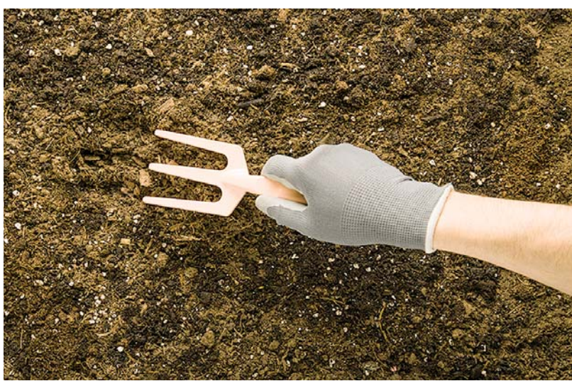
МАКСИМ ВИКТОРОВ.

же те, что засажены растениями-сидератами, нужно тщательно перекопать, в то время как легкие почвы достаточно лишь аккуратно разрыхлить, используя плоскорез. Для подготовки участка к новому сезону посадок сначала надо удалить корни сорняков, находящиеся на глубине от 3 до 6 сантиметров. Их следует аккуратно выкопать, измельчить и оставить на солнце на пару дней для высыхания, что приведет к их гибели. Важно проводить эти работы при благоприятных погодных условиях – в сухую и теплую пору.