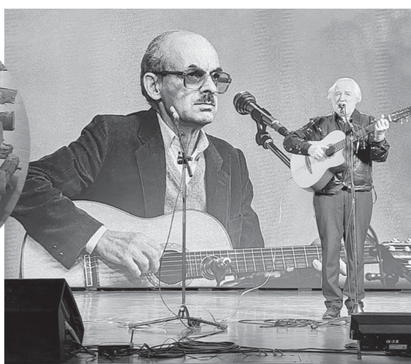
Поэт председатель жюри Юрий Лорес.