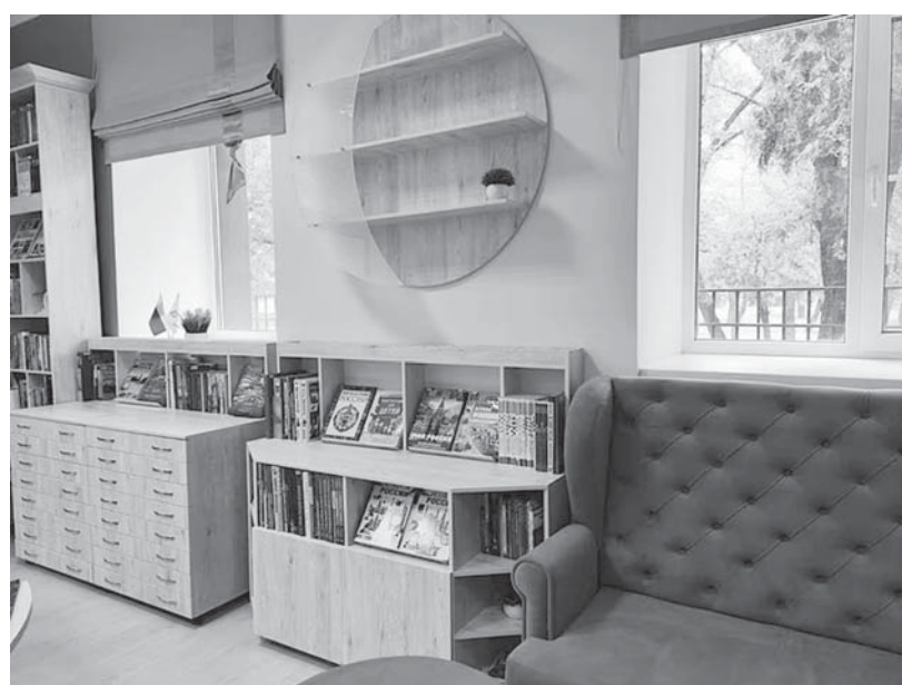
Модельная муниципальная детская библиотека в Невинномыске.

В каждой модельной, будь то в городе или на селе, есть что-то интересное, отличное от других. К примеру, библиотека села Кугульта Грачевского округа имеет в своем распоряжении комплекс развития мелкой моторики и активно работает с детьми. А в селе Шведино Петровского муниципального округа с успехом собираются за «шведским столом», чтобы обсудить литературные новинки. Даже создают мультфильмы по сказкам местных авторов!